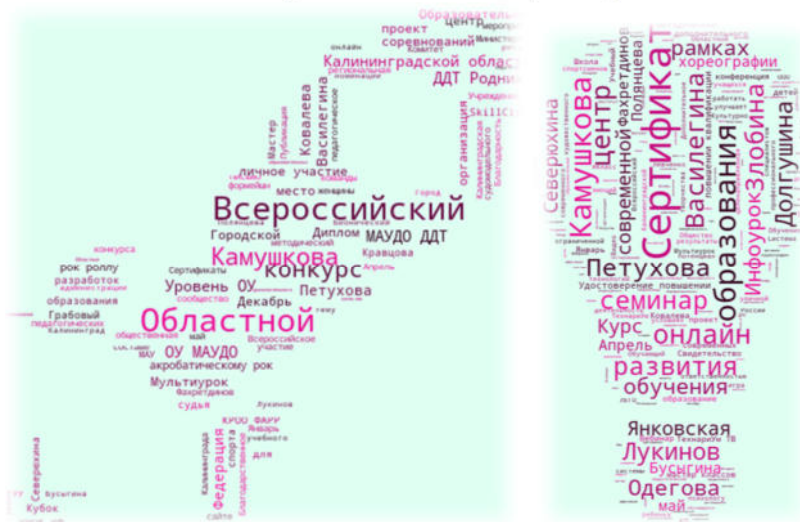
Рис. 2. Определение наибольшего вклада в методическую работу и самообразование МАУДО ДДТ «Родник» по частотности слов в отчете