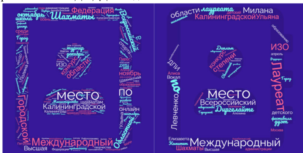
Рис. 3. Определение наибольшего вклада в победы обучающихся МАУДО ДДТ «Родник» по частотности слов в отчете