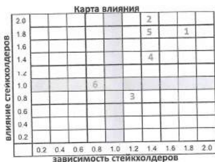
Рис. 1- Ранжирование стейкхолдеров

Для рассматриваемой организации характерны следующее ранжирование. Карта отражает ранг стейкхолдеров в общем ряду, показывает кто в большей степени влияет на организацию и зависит от нее. (2-сильно влияет/сильно зависит; 1- влияет/зависит; 0 - не влияет /не зависит).