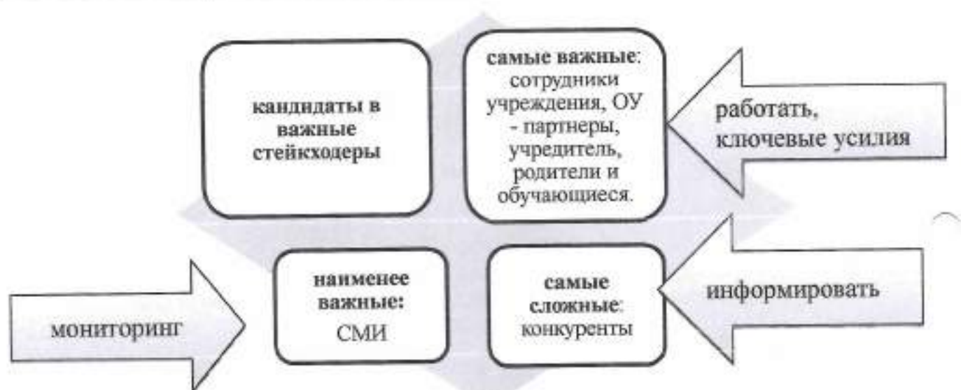
Рис. 2 - Тактика взаимодействия со стейкхолдерами

Наиболее проблемной точкой взаимодействия со стейкхолдерами является пересечение роли ОУ - партнеров и тех же самых образовательных учреждений в роли конкурентов. Занятость внеурочной деятельностью детей возросла в последнее время. Школы вынуждены отказываться от традиционного сотрудничества по этой причине.