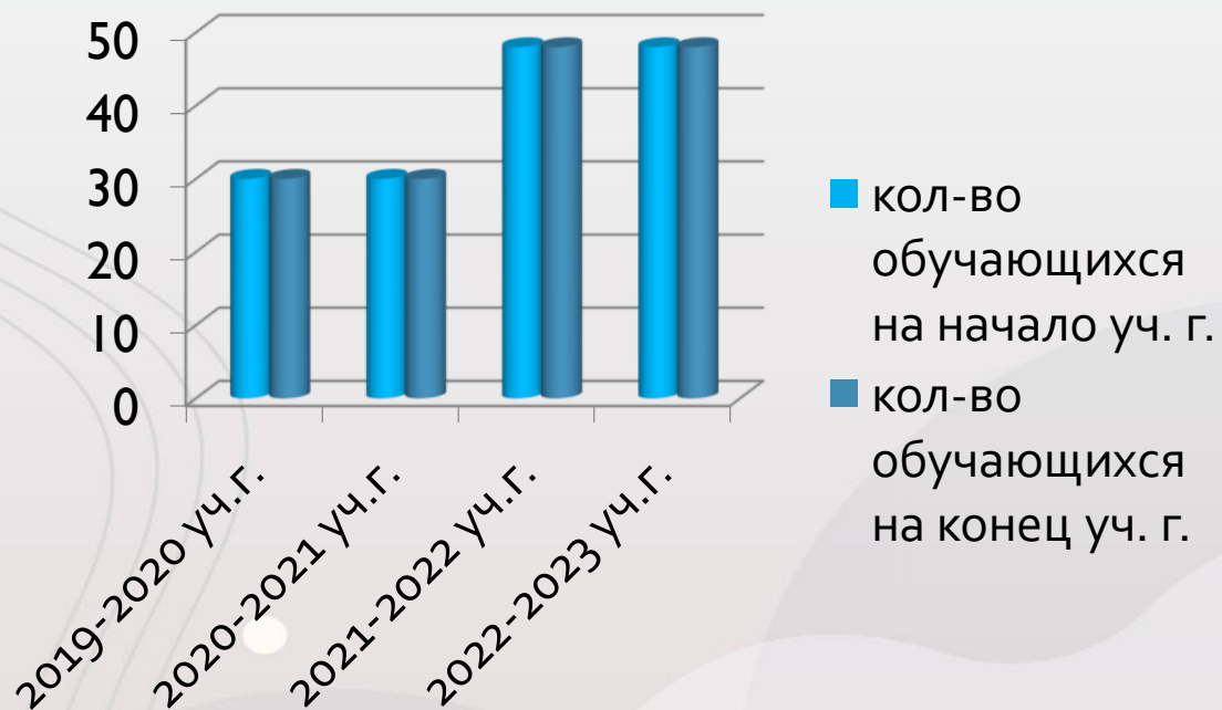
Диаграмма 1 – Сохранность контингента обучающихся

Вывод: анализ данных диаграммы 1 позволяет проследить востребованность программы и сохранность контингента обучающихся за последние 4 года.